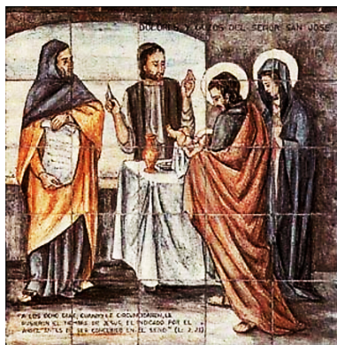
Figura 5: Tercer Dolor

El entorno temporal en que se produjeron los hechos importantes de la vida de nuestro Señor estuvo siempre ligado al calendario que Dios mismo otorgó a su pueblo porque la Ley es sombra de bienes futuros (Heb 10,1). Así su muerte, para obtener nuestra liberación del pecado, ocurrió en Pascua y su Resurrección, anticipo de la nuestra, sucedió en el primer de la ofrenda de primicias (Lev 23, 15-16). El día del Nacimiento de Jesús también siguió este principio.