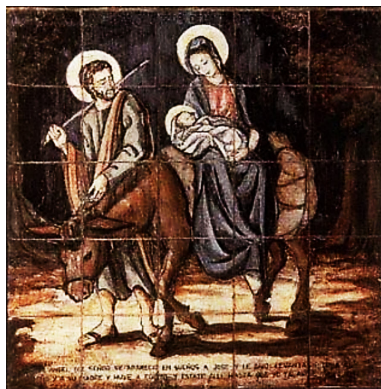
Figura 9: Quinto Dolor

lo mostraba durante varios días desde Jerusalén inmóvil, poco antes del