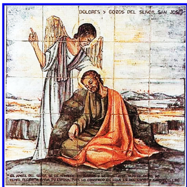
Figura 2: Primer Gozo

La consecuencia principal de aquella desobediencia de nuestros primeros padres fue polvo eres y al polvo volverás (Gen 3,19) porque el salario del pecado es la muerte (Rom. 6,23). Pero gracias a la obediencia de José y María nació en la historia el Cordeiro de Dios que quita el pecado del mundo (Jn. 1,29). Y entonces habiendo venido por un hombre la muerte, también por un hombre viene la resurrección (1 Cor 15, 21). Y por tanto algún día eliminará para siempre la muerte. (Y) el Señor Dios enjugará las lágrimas de todos los rostros (Isa 25,8), el tiempo de los muertos será juzgado (Ap. 11,18) y la muerte en adelante no existirá (Ap. 21,1). Lo que en la historia ocurrió y