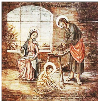
Figura 12: Sexto Gozo

Además de aquel significado toponímico del nombre Nazareno para los contemporáneos de Jesús, San Mateo dice que también era fruto de una profecía (Mt 2,24), por tanto detrás de él hay una razón que da luz a los hombres porque la profecía es lámpara que luce en lugar oscuro (1 Pe 2,19). Sin embargo, en la Sagrada Escritura esa profecía no está escrita. Entonces tenemos que considerar alternativamente que Dios llama a cada estrella por su nombre (Sal 147,4) y por tanto detrás de los nombres estelares hay un significado de una misión divina, de la que cada estrella es señal. Sirio, la estrella más brillante del cielo, en hebreo se denomina Nas-Seir-Ene, se pronuncia nazareno y