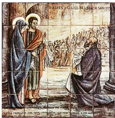
Figura 8: Cuarto Gozo

El Espíritu Santo se manifiesta habitualmente a través de almas humildes, abiertas a Dios porque Dios resiste a los soberbios y a los humildes da la gracia (1 Pe 5,5). En este tiempo de cambio de época en el que el sol se convertirá en tinieblas y la luna en sangre, ante la venida del día de Yahveh grande y terrible (Joe 3,4), la Sagrada Escritura afirma que Yo derramaré mi Espíritu en toda carne. Vuestros hijos y vuestras hijas profetizarán, vuestros ancianos verán en sueños y vuestros jóvenes tendrán visiones. También sobre mis siervos y mis siervas derramaré mi Espíritu en aquellos días (Joe 3, 1-2). Y así, Dios escogió a los videntes de muchas apariciones marianas entre los niños, como en la Salette, Lourdes, Fátima, Garabandal o Medjugorje.