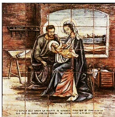
Figura 10: Quinto Gozo

En los días del Nacimiento de Jesús, 10 de las 12 tribus de Israel ya no vivían en la Tierra prometida desde hacía más de 7 siglos. Las dos tribus restantes 70 años después también marcharon al exilio entre los gentiles durante casi 20 siglos. Como Jesús, María y José, los hebreos han experimentado largo tiempo lo que es vivir en nación extranjera. Sólo en el año 1948, la tribu de Judá formó la nueva nación de Israel en lo que antaño fue la tierra de sus antepasados, cumpliendo con ello una señal escatológica, anuncio de la llegada del Reino, profetizada por el mismo Jesús: caerán al filo de la espada, los llevarán