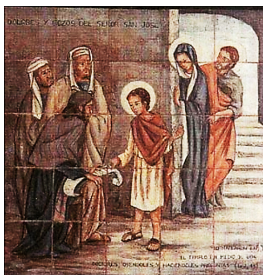
Figura 14: Séptimo Gozo

Hoy como entonces, las señales de los tiempos de la nueva Venida de Jesús se están cumpliendo sin que los doctores las acepten. Jerusalén será pisoteada por gentiles, hasta que se cumpla el tiempo de los gentiles (Lc 21, 24). Primero tiene que llegar la apostasía (2 Tes 2,3). En los últimos días (...) los hombres serán egoístas, codiciosos, arrogantes, soberbios, blasfemos, desobedientes de los padres, ingratos, impíos, crueles, implacables, calumniadores, desenfrenados, inhumanos, enemigos del bien, traidores, temerarios, envanecidos, más amantes del placer que de Dios, guardarán ciertos formalismos de la piedad pero habrán renegado de su verdadera esen-