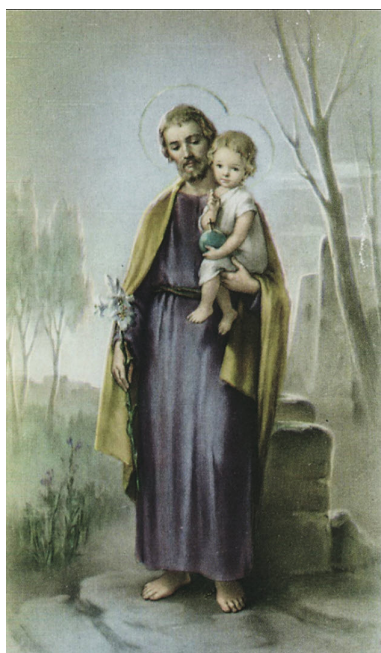
Figura 15: Consagración

San José, Padre de Dios y Padre nuestro. En presencia de tu hijo Jesús Sacramentado y de María tu Esposa, Mujer del Apocalipsis, Inmaculada de Guadalupe, pongo en tu Corazón todo aquello que soy y tengo, para que lo purifiques y presentes en unión con María y Jesús a Dios Uno y Trino como ofrenda de amor. Con la entrega de mi ser, deseo adorar y alabar a Dios Padre Creador, a Dios Hijo Redentor y a Dios Espíritu Santo Santificador. Asimismo por tu paternal intercesión pido perdón a Dios por mis pecados, ofensas y negligencias y las gracias que necesito para servir con docilidad y prontitud a los deseos divinos para mi vida.