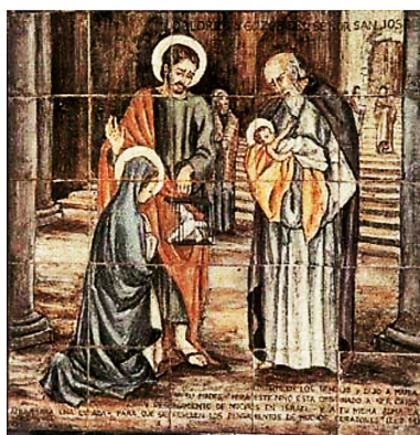
Figura 7: Cuarto Dolor

Sólo han pasado cuarenta días desde el Nacimiento de Jesús en la gruta de Belén. José, como cabeza de familia camina marcando el paso al burro que lleva las dos criaturas más divinas de la historia. Conforme se acerca a Jerusalén considera que trae al Dios encarnado por primera vez a la casa de su Padre Dios, centro de toda la actividad religiosa en Israel. Todo el eco de las profecías sobre el Salvador y los deseos de tantos justos que ansiaron verlo, resuenan en su corazón que probablemente va diciendo a Dios: “Soy indigno de traerlo, pero gracias infinitas, Padre, por tu elección sobre mí para hacerlo”. María y