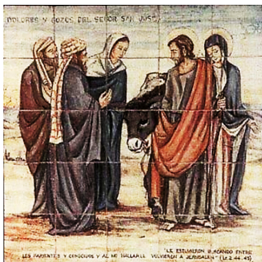
Figura 13: Séptimo Dolor

Cualquier padre o madre que se vean en la situación de perder un hijo pequeño en medio de una muchedumbre sienten un agudo dolor que les hace humanamente estar interiormente trastornados. Las preguntas se suceden sin respuesta. La angustia va y viene en oleadas, mientras hacen todo lo posible para encontrarlo. José y María también acudieron a todo lo imaginable para encontrar a Jesús. En medio de la búsqueda tendrían momentos de llanto y desconsuelo. Tres días en esa circunstancia es mucho tiempo. José, como el jefe de familia, lo llevaría con entereza y sentido práctico para no aumentar el dolor de