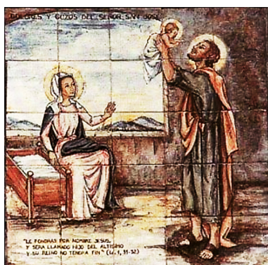
Figura 6: Tercer Gozo

Isaías, uno de los grandes profetas de Israel, había dicho 700 años antes: Mirad, la virgen está encinta y dará a luz un hijo, a quien pondrá por nombre Enmanuel (Isa 7,14). José conocía bien la verdad de la primera parte de este vaticinio. Sin embargo el nombre anunciado no coincidía con el que el Ángel le había mandado poner tanto a él como a María por separado. ¿Qué razón podía haber tras este desencaje?