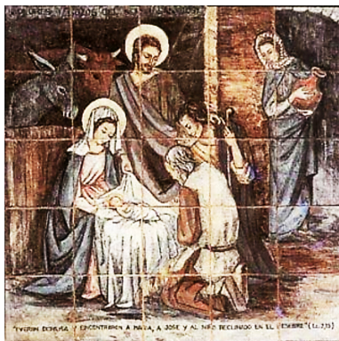
Figura 4: Segundo Gozo

Como en los tiempos de José, tampoco el mundo espera hoy la nueva Venida de Jesús. Si cabe, el hombre está hoy aún más ajeno a Dios que entonces. La apostasía se ha instalado en nuestra sociedad como muestra de modernidad. Tampoco la Iglesia estudia y difunde esta verdad Dogma, como si nunca fuera a suceder esta parte del depósito revelado. Y esto a pesar de que ya han ocurrido señales escatológicas evidentes como la vuelta de los judíos a su tierra (Lc 21,24) o la apostasía generalizada (2 Tes 2,3).