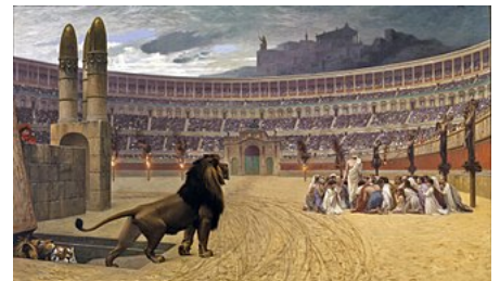
La última oración de los mártires cristianos , cuadro de 1883 de Jean-Léon Gérôme .