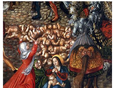
Matanza de los Inocentes (detalle) de Lucas Cranach el Viejo (c. 1515), Museo Nacional de Varsovia.