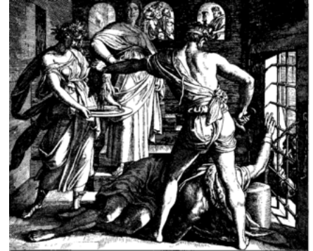
Decapitación de Juan el Bautista de Julius Schnorr von Carolsfeld, 1860.

La era de los mártires también obligó a la Iglesia a enfrentarse a problemas teológicos , como la respuesta adecuada para aquellos cristianos que perdieron y renunciaron a la fe cristiana para salvar sus vidas: ¿se les permitiría regresar a la Iglesia? Algunos opinaron que no deberían, mientras que otros dijeron lo contrario. Al final, se acordó permitirles regresar después de un período de penitencia . La readmisión de los lapsi se convirtió en un momento definitorio en la Iglesia porque permitió el sacramento del arrepentimiento y su readmisión en la Iglesia a pesar de los problemas del pecado . Esto provocó los cismas donatistas y novacionistas . 10 11