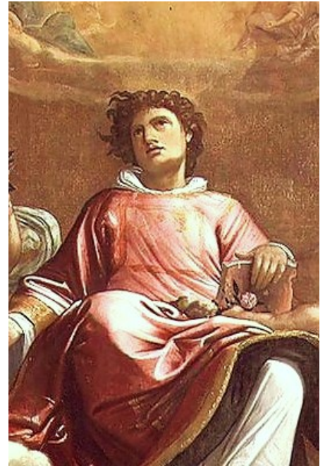
San Esteban , que murió lapidado , fue el primer mártir cristiano. Cuadro de Giacomo Cavedone .

Es en este sentido que el término aparece por primera vez en el Libro de los Hechos , en referencia a los Apóstoles como 'testigos' de todo lo que habían observado en la vida pública de Cristo. En Hechos 1:22 4 , Pedro , dirigiéndose a los apóstoles y discípulos con respecto a la elección de un sucesor de Judas , emplea el